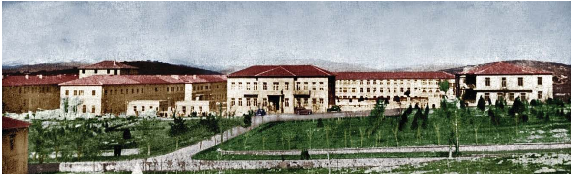
Resim-11: Gülhane Cebeci Binaları, Sağlık Bilimleri Üniversitesi, Gülhane Tıp Tarihi Müzesi, Ankara

Gülhane hastanesi binasına kat ilavesi, ameliyathane ve doğum odaları yapılmış olmasına karşın bina hizmet için yeterli gelmemekte ve fiziki şartları gittikçe kötüleşmekte olduğundan 1941 yılında 300 yataklı bir proje yapılması planlanmıştır. Ancak mevcut binanın bulunduğu bölgenin arkeolojik değerinin bulunması sebebiyle ve o dönem askeri okulların Ankara'ya taşınması da söz konusu olduğundan Gülhane'nin Ankara'ya taşınması, geçici olarak "Cebeci Merkez Hastanesinde" hizmet verilmesi uygun görülmüştür. 21 Temmuz 1941 günü 28 vagon eşya ve malzeme Sirkeci Gar'ından Haydarpaşa Gar'ına feribotla oradan Ankara'ya doğru hareket etmiştir. Cebeci Merkez Hastanesi ile ortak bir çalışma sistemi belirlenmiş isim olarak da "Cebeci Gülhane Askeri Tababet Okulu" adı ile General Abdulkadir Noyan'ın çabası ile "Gülhane" ismi tescillenmiştir (4).