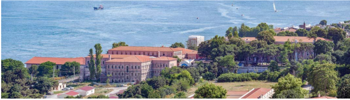
Resim-10: "Gülhane Seririyat Hastanesi günümüzdeki durumu"

Gülhane Seririyat Hastanesi binası "Gülhane"nin 1941 yılında Ankara'ya taşınmasının ardından Sarayburnu Askeri Hastanesi, daha sonra Sarayburnu Askeri Verem Hastanesi olarak 1964 yılına kadar hizmet vermiş ve hastalar Çamlıca Askeri Sanatoryum Hastanesine nakledilerek bina boşaltılmıştır (4). Bugün Topkapı Sarayı'nın Marmara denizine bakan cephesinde, T.C. Cumhurbaşkanlığı Milli Saraylar İdaresi Başkanlığı ve T.C. Kültür ve Turizm Bakanlığı tarafından kültür varlığı olarak korunmaktadır (11).