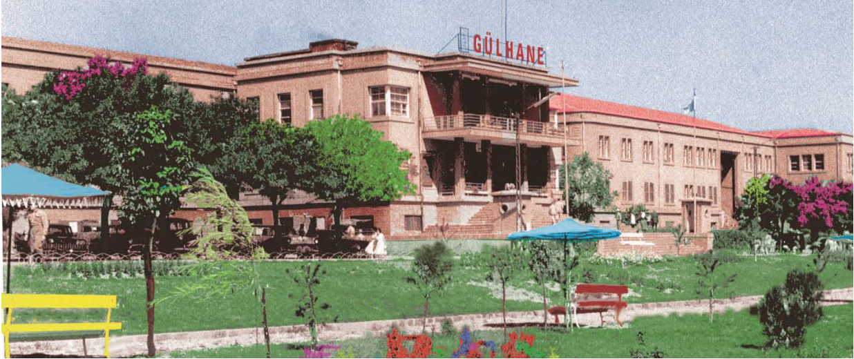
Resim-12: Gülhane Bahçelievler, Anıttepe, Sağlık Bilimleri Üniversitesi, Gülhane Tıp Tarihi Müzesi, Ankara

Cebeci’deki bina ve arazinin Ankara Üniversitesi Tıp Fakültesine devredilmesi Bahçelievler’deki binaların yeterli ve sağlık hizmetine uygun olmaması sebebiyle; askeri tıp eğitiminin gerektirdiği nitelikte yapıların, alanların inşa edilebileceği, sivil hastaların da rahatlıkla iyi hizmet alabileceği bir arazi arayışında bulunulmuştur. Etlik’te yer alan günümüzde Sağlık Bilimleri Üniversitesi Gülhane Külliyesi ve Sağlık Bakanlığı Gülhane Eğitim ve Araştırma hastanesinin bulunduğu 300 bin metrekarelik araziye Gülhane Askeri Tıp Akademisi binaları ve 800 yataklı hastanesi inşa edilmiş, Ekim 1971’de de taşınmıştır. Hastanenin her bir katında 25’şer yataklı 4 koridorunda 100 hasta yatağı, hasta odaları ile kliniklerin öğretim üyeleri birbiri ile bağlantılı olarak yer alacak, poliklinikler, laboratuvarlar ve ameliyathanelerde ana binada olacak şekilde planlanmıştır (14).