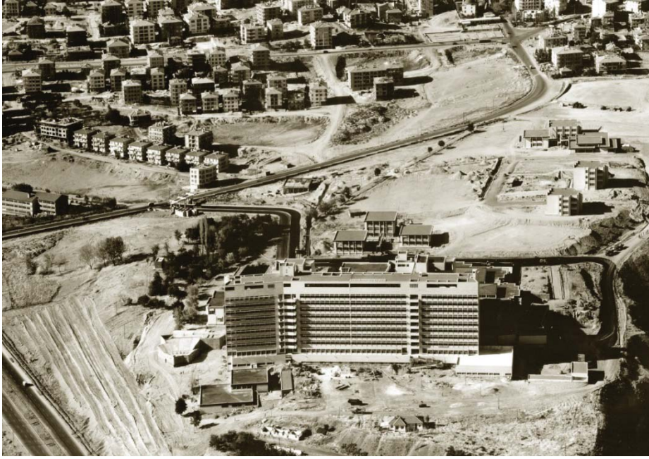
Resim-13: Gülhane Askeri Tıp Akademisi Etlik, Sağlık Bilimleri Üniversitesi, Gülhane Tıp Tarihi Müzesi, Ankara